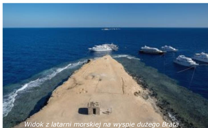
Widok z latarni morskiej na wyspie dużego Brata

„Top północy” to trasa Safari łącząca najpopularniejsze miejsca nurkowe północnej części Morza Czerwonego. W ciągu tygodnia odwiedzimy leżące na otwartym morzu Wyspy Braci ( Brother Islands ) oraz zanurkujemy