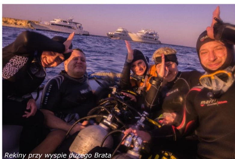
Rekiny przy wyspie dużego Brata