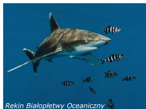
Rekin Białopłetwy Oceaniczny

na najbardziej znanych wrakach i rafach położonych pomiędzy Safagą i Półwyspem Synaj. Safari adresowane jest do zaawansowanych i średniozaawansowanych nurków. Zaczynamy od dwóch nurkowań w przybrzeżnym rejonie Hurghady, a następnie kierujemy się na Wyspy Braci. Przed nami trzy nurkowania na Wielkim Bracie, podczas których zobaczymy leżący na krawędzi północnego plateau wrak frachtowca „Numidia”, a także wrak frachtowca „Aida” leżącego w centralnej części wyspy. Trzecie nurkowanie