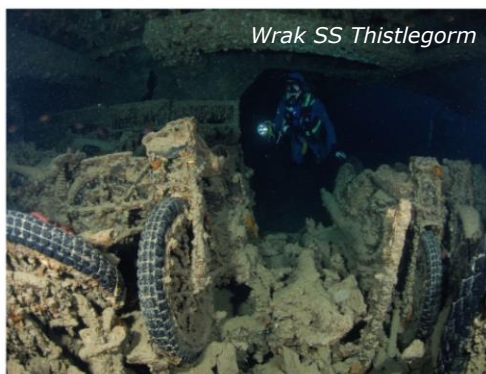
Wrak SS Thistlegorm

Poranne nurkowanie na północnym plateau jest okazją do spotkania z szarymi rekinami rafowymi , majestatycznie wypływającymi do nurków z błękitnej toni. Na nurkowaniu przy wschodnim brzegu wyspy zobaczymy rzędy potężnych gorgonii, wśród których uwijają się ławice ryb. Popołudniowe nurkowanie wykonamy wzdłuż zachodniego brzegu rafy, kończąc je przy plateau południowym. Rozpoczynając powrót do brzegu w rejonie Safagi odwiedzimy rafę Panorama lub Abu Kafan oraz zanurkujemy na wraku pasażerskiego promu Salem Express . Kolejne godziny upłyną na rejsie w stronę Hurghady, którą mijamy i cumujemy do Stalowej Rafy ( Abu Nuhas ). Wykonamy tutaj nurkowanie na wraku „ Gianis D ” i nurkowanie nocne przy ścianie rafy. Nad ranem przepływamy przez cieśninę Gubal i dwukrotnie nurkujemy na wraku najszlachetniejszego wraku na Morzu Czerwonym – SS „Thistlegorm” . Następnie wracamy w kierunku Abu Nuhas i zanurzamy się przy wraku „ Carnatica ” lub „ Chrysouli ”. Ostatniego dnia odwiedzamy rafy w pobliżu Hurghady (Abu Ramada lub Giftun) oraz wrak ścigacza „ El Mina ” zatopionego podczas wojny 7-dniowej.